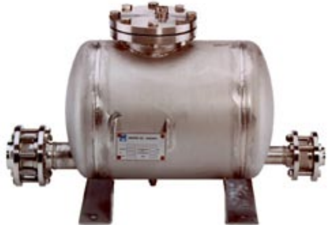
Pumpenlose Kondensatrückförderanlage Typ FPS 14

Wir rechnen Ihnen gerne aus, wie schnell sich entsprechende Änderungen Ihrer Anlage tagtäglich in Geld auszahlen.